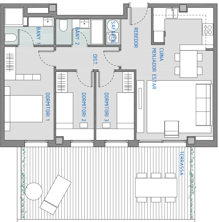
HABITATGE 5 - PRIMER 2a