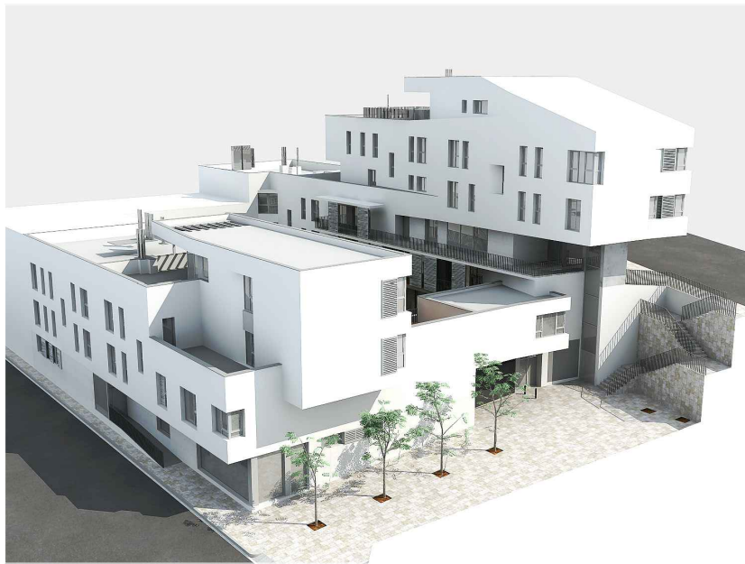
c/ Cristòfol Colom - c/ Rafel Casanova - c/ Lluís Millet - c/ Genís Sala _ Santa Perpètua de Mogoda